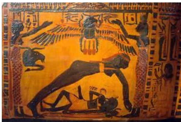
LE SYMBOLE ÉGYPTIEN DE LA MÈRE DIVINE NOUT ÉTENDUE SUR GEB

La volupté est indescriptible, c'est l'AbraXas de nous autres Gnostiques, c'est le feu de la vie, c'est "Nout" le pouvoir grandiose qui éveille la Kundalini en nous et fait de nous des Dieux, c'est cette jouissance solennelle de la connexion sexuelle.