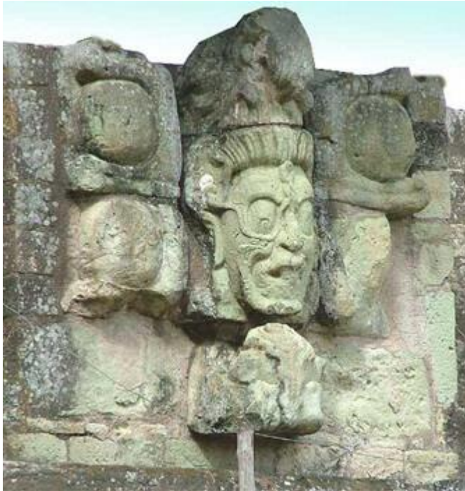
FIGURE D'UN LOGOS