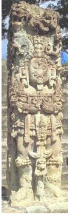
SPÉCIFICATION DE L'EGO ANIMAL