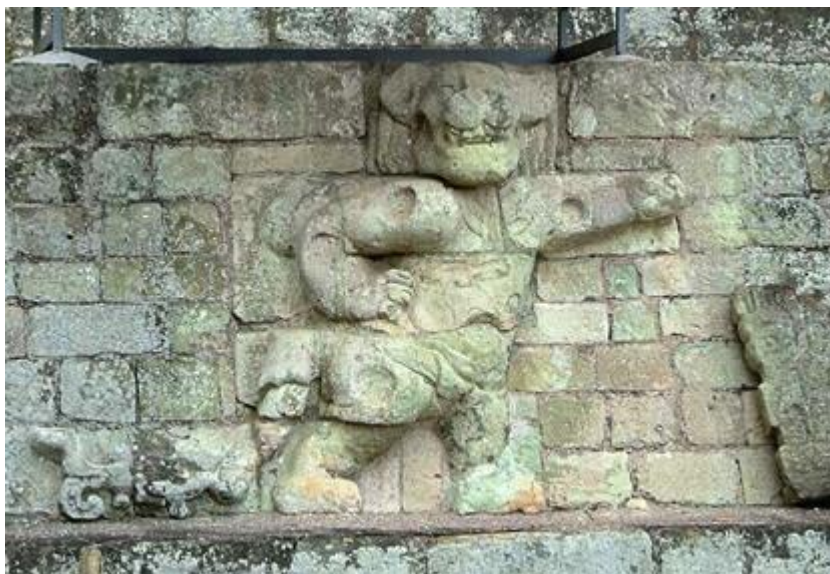
XOLOTL - LUCIFER - PROMÉTHÉE

Le Jaguar maya est indubitablement Xolotl lui-même ou Lucifer nahuatl.