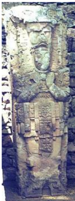
REPRÉSENTE UN ADEPTE

Visage : Grave, avec un semblant de barbe.