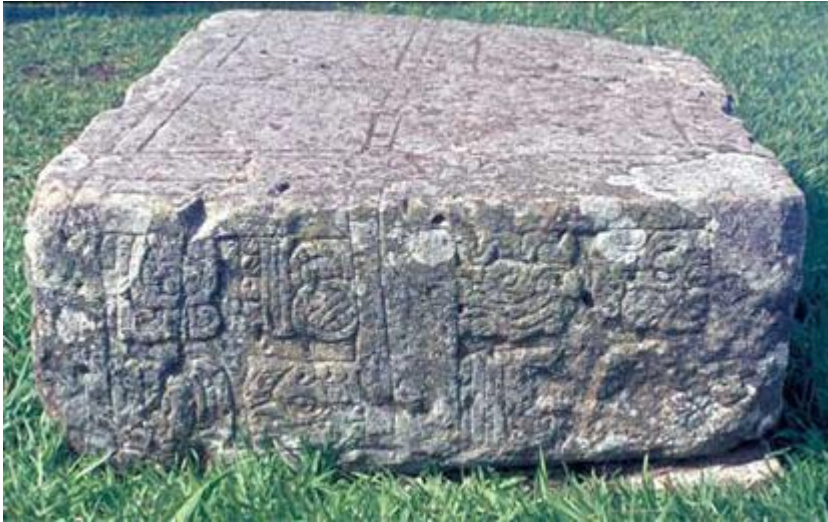
CROIX DES ÉLÉMENTS

Le carré et la croix au centre sont très bien faits.