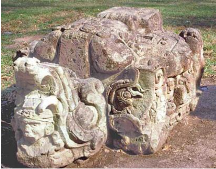
TRAVAIL DANS LA NEUVIÈME SPHÈRE

Cette figure sculptée dans la pierre est très étrange. En quel autre lieu pourrions-nous trouver une si étrange représentation ?