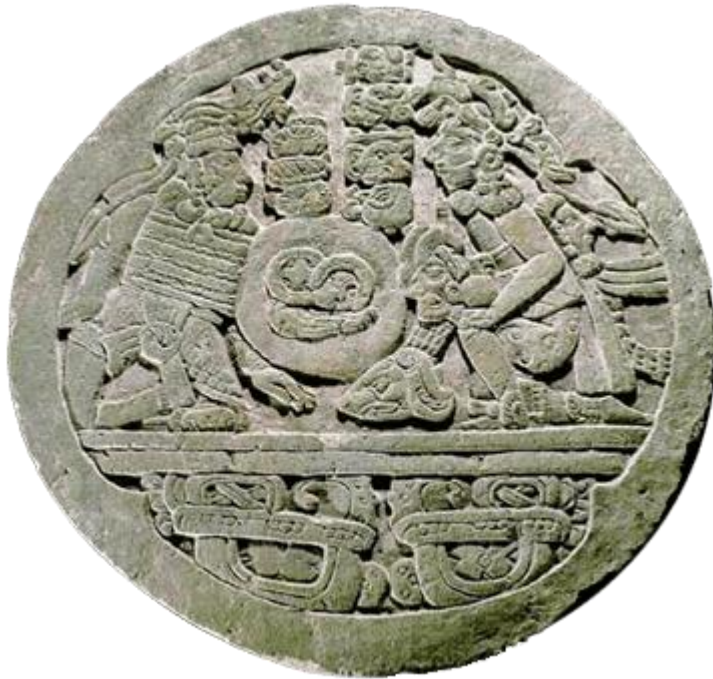
PIERRE AVEC L'ARCANE 18

Cette pierre indique clairement l'Arcane 18 de la Kabbale hébraïque.