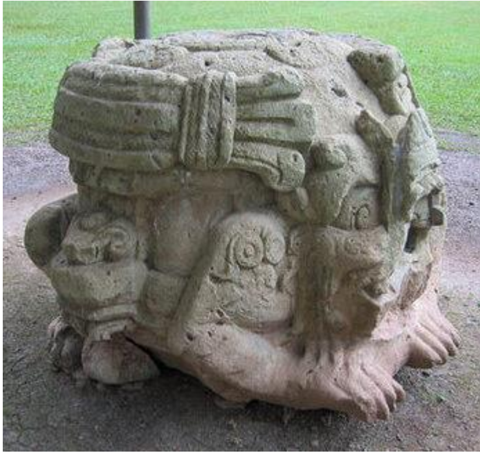
LES QUATRE FORCES

Nous pouvons observer quatre lignes autour de la pierre, à l'image du Soleil.