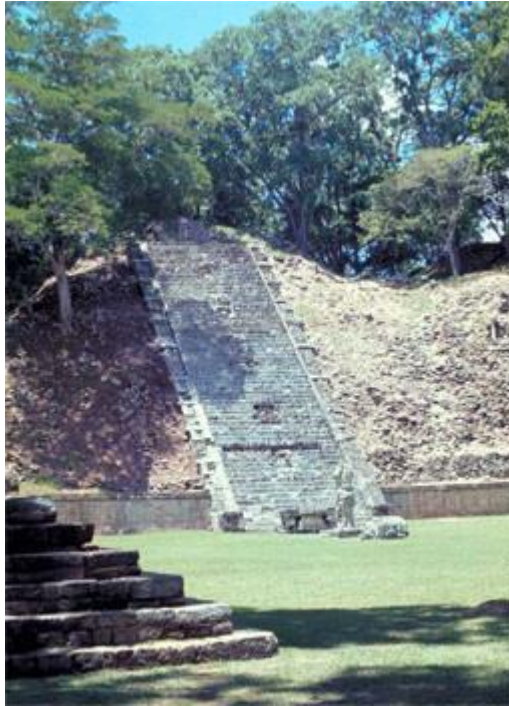
PERRON DES HIÉROGLYPHES

Cette sculpture est une claire allusion aux douze travaux d'Hercule. Les douze travaux d'Hercule, le prototype de l'Homme authentique, indique, montre la Voie Secrète qui doit nous conduire jusqu'aux degrés de Maître Parfait et de Grand Élu.