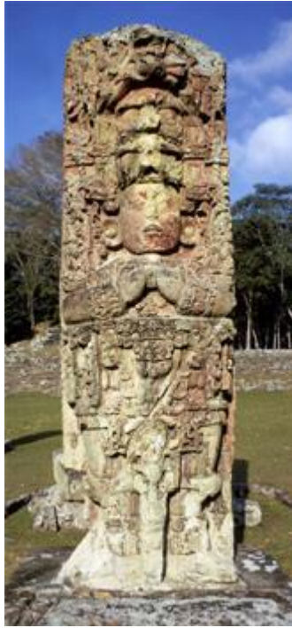
LA PIERRE DE L'AUTORÉALISATION