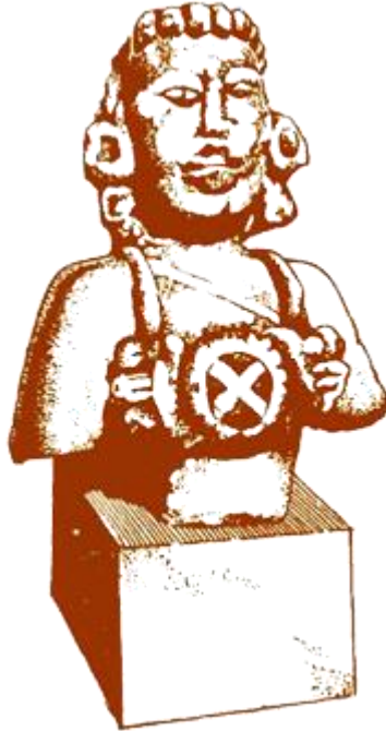
BUSTE AVEC LA CROIX DE SAINT ANDRÉ

Nous voyons un précieux lambel au centre de la poitrine.