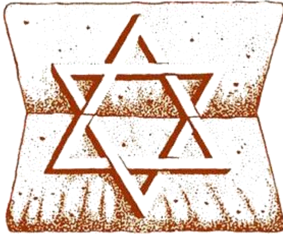
ÉTOILE DE DAVID

Cette figure est exactement l'étoile de Salomon elle-même, très bien stylisée.