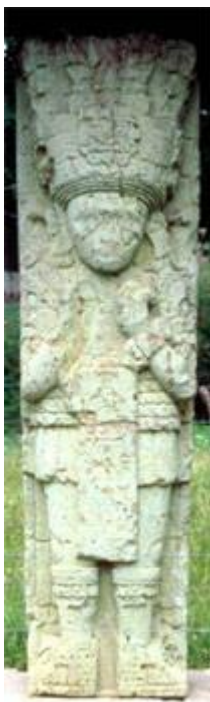
UN DEVA DE LA NATURE

Dans la vision de l'harmonie de toutes choses, nous découvrons avec un étonnement mystique, la partie spirituelle de la Nature, en d'autres termes, nous trouvons les fameux Malachim ou Rois Angéliques.