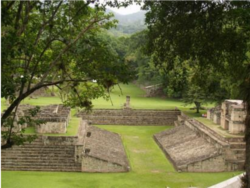
TERRAIN DE LA BALLE RELIGIEUSE

On appelle communément cette enceinte, le champ de la pelote, mais son nom est erroné.