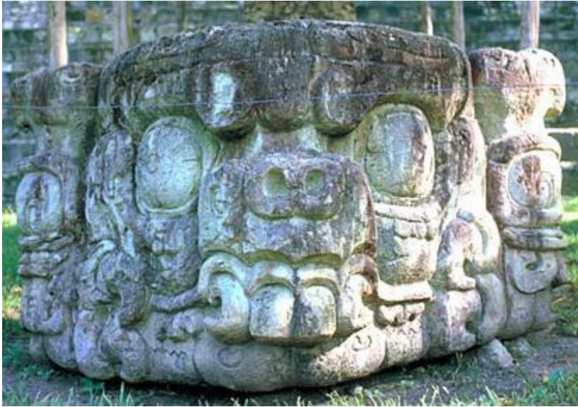
PIERRE DU SACRIFICE

Quand la civilisation maya était dans sa splendeur, jamais on ne commit les sacrifices que l'humanité actuelle attribue à certaines cultures antiques. La culture maya est solaire. Les Mayas furent instruits par des Êtres Solaires parfaits.