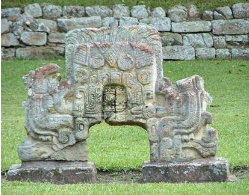
TEMPLE DE LA SAGESSE

Nous voyons dans cette gravure de pierre ceci :