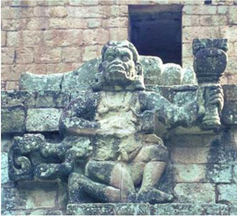
CROIX JAÏNA OU SVASTIKA. CROIX EN MOUVEMENT

Elle représente le Yoga-Sexe, le Maïthuna, la Magie Sexuelle, l'Alchimie Sexuelle.