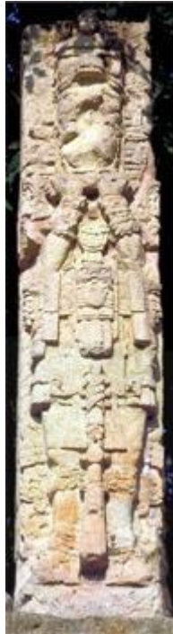
TRAVAIL DE L'ALCHIMISTE

Il s'avère très intéressant que toutes les sculptures de Copán aient le bâton, le sceptre, au centre.