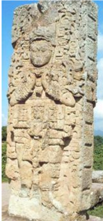
CROIX DE SAINT ANDRÉ