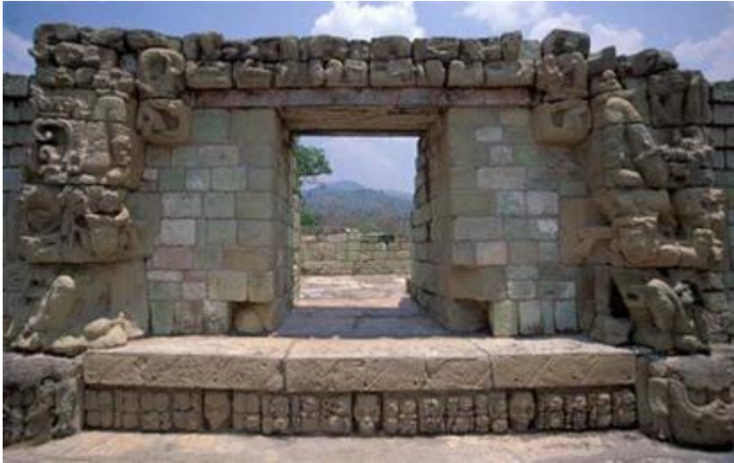
TEMPLE DES MÉDITATIONS

Il est certain que le nom du Temple des Méditations correspond au travail qu'on y réalisait. C'était un Temple où l'on pratiquait la Méditation.